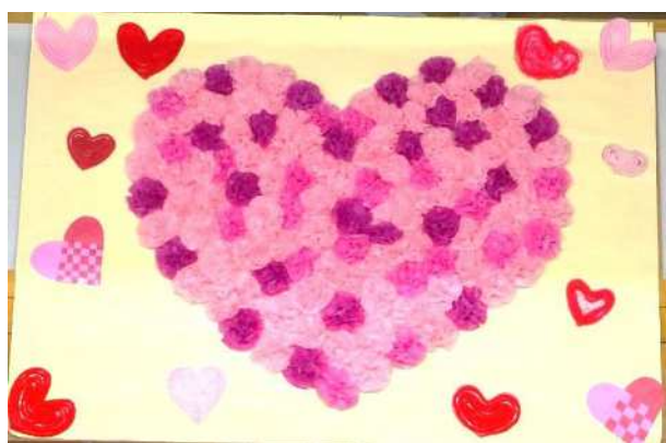
2月の壁画「ハートがいっぱい」